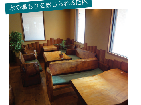
取材=山邊 真也 新谷 洋二

創業当初の30年前から使っている長野県白馬産の橋の木のテーブル等、特注家具が店内の落ち着いた雰囲気を引きださせる。